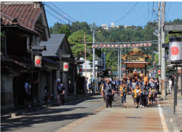
↑秋まつりで町を練り歩く囃子屋台(原町通り)

左沢の河岸は、江戸時代、上流で使われた小鵜飼船と左沢より下流で使われた船の荷物を積み替える場所として重要な役割を果たしました。今の旧最上橋のたもと付近には「米沢舟屋敷」があって、その東側にあたる「川端」から月布川合流点付近に船が着いたと伝わります。最上川舟運は、全国とつながる流通・往來を左沢にもたらしました。当地に伝わる「百目木甚句」の歌詞には、「松前のにしん こんぶ」「京の友禅博多帯」など北前船が北海道や上方へ向かった時の商品がうたわれています。また、江戸時代、最上川舟運によってもたらされた富を背景として左沢の町衆が参加した天満神社の祭礼は、囃子屋台やシシ踊りが町を練り歩く盛大なものでした。この囃子屋台などは、一時途切れながらも各地区で継承されており、普段は左沢駅前の交流ステーションに展示され、大江の秋まつりでお囃子とともに町中を回って町衆が造りだした芸能文化の景観を今に伝えます。