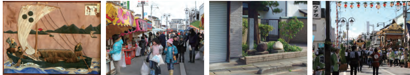
↑小鵜飼船絵巻(明治時代・巨海院) ↑現代の初市(横町) ↑市神様(原町) ↑大江の秋まつり(内町・横町)

「最上川の流通・往來及び左沢町場の景観」は、左沢の暮らしに根差した文化的景観です。左沢は、五百川峡谷を流れ下った最上川が村山盆地に流れ出る場所にあたります。交通の要衝であった左沢の楯山には、中世、最上川を見下ろすように大規模な山城が築かれました。江戸時代に入ると小漆川に城が移り、今の町並みの骨格となる城下町が整備されます。また、「米沢舟屋敷」が置かれるなど最上川沿いに河岸が展開し、最上川舟運の恩恵を受けながら町の賑わいが創出されました。今の左沢の景観は、各時代の姿を継承しつつ、時代に合わせた変化を経て形成されました。山城跡に所在する楯山公園からは、楯山の麓で大きく曲がる最上川や段丘上に広がる左沢の町並み、さらに遠く西方に朝日連峰が連なる様子を望むことができます。町場では、江戸時代からの通り沿いに並び建つ土蔵や商店建築、社寺に納められた奉納物、秋まつりや初市といった行事などが、かつて舟運とともに営まれた町のくらしを伝えています。この絵図は、左沢の原町周辺を描いたものです。原町通りは江戸時代の初めころ小漆川城下町として造られたとされ、最上川の河岸や舟屋敷と小漆川城や代官所を結ぶ道でした。通り沿いには元造り酒屋の店蔵などが並び建ち、舟運時代の繁栄を今に伝えています。絵図と一緒に原町を散策して、歴史が薫る風景を探してみたいかがでしょうか。