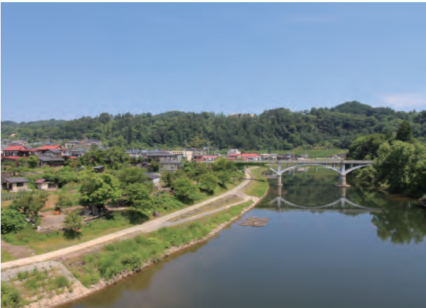
↑左沢の東端を流れる最上川(最上橋から)

左沢の河岸は、江戸時代、上流で使われた小鵜飼船と左沢より下流で使われた船の荷物を積み替える場所として重要な役割を果たしました。今の旧最上橋のたもと付近には「米沢舟屋敷」があって、その東側にあたる「川端」から月布川合流点付近に船が着いたと伝わります。最上川舟運は、全国とつながる流通・往來を左沢にもたらしました。当地に伝わる「百目木甚句」の歌詞には、「松前のにしん こんぶ」「京の友禅博多帯」など北前船が北海道や上方へ向かった時の商品がうたわれています。また、江戸時代、最上川舟運によってもたらされた富を背景として左沢の町衆が参加した天満神社の祭礼は、囃子屋台やシシ踊りが町を練り歩く盛大なものでした。この囃子屋台などは、一時途切れながらも各地区で継承されており、普段は左沢駅前の交流ステーションに展示され、大江の秋まつりでお囃子とともに町中を回って町衆が造りだした芸能文化の景観を今に伝えます。