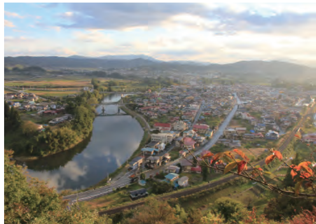
↑楯山公園から眺めた最上川と現在の左沢の町並み

左沢の繁栄は、大江町の本郷・七軒地区に広がる農山村集落との互惠関係のうえに成り立っていました。農山村で生産された青芋や薪炭などの農・林産物は左沢の町場で取引され、最上川舟運の港町であった左沢の繁栄に欠かせない物でした。文化13年(1816)、左沢河岸から積み下した村山郡の特産物として豆135俵とともに青芋196駄(1駄は馬1頭に背負わせられる荷物)が記録されています。農山村の特産物であった青芋は、最上川舟運と日本海を通る西廻り航路を経て、奈良町や小千谷縮の原料として上方や北陸に出荷されました。大江町立歴史民俗資料館は、七軒地区の十郎畑で青芋などを扱った問屋(旧斎藤半助家)を移築したものです。寛文・享保ころから活躍し、左沢の内町に2軒の分家が表加賀屋・裏加賀屋として店を出して、各地に青芋を送りました。また、青芋を扱った左沢の商人たちが舟運の安全を願って奉納した手水鉢が巨海院に伝わっており、そこに込められた祈りとともに、商人たちの財力や結束力を今の私たちに感じさせます。