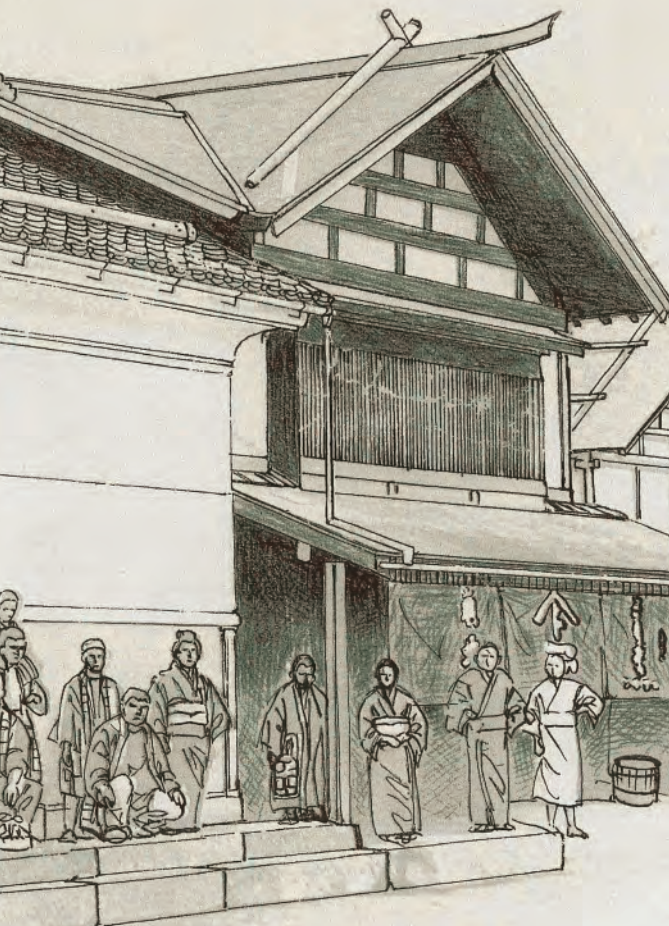
表紙・裏表紙はヤマト葛地商店が所蔵する大正～昭和前期頃の原町通りが撮られた写真を加工したものの

【制作・発行】大江町教育委員会【左沢文化的景観絵図原町編作画】志村直愛 〒990-1163山形県西村山郡大江町大字本郷丁373-1 TEL:0237-62-3666 大江町ホームページ: http://www.town.oeyamagata.jp/ ※絵図で示した建物は、絵図範囲内に所在する重要な文化的景観の重要な構成要素です。また、記載した建物の建築年代は、所有者等からの聞き取りによります。