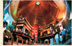
◀展示ホールでは秋まつりの雰囲気を味わえます。