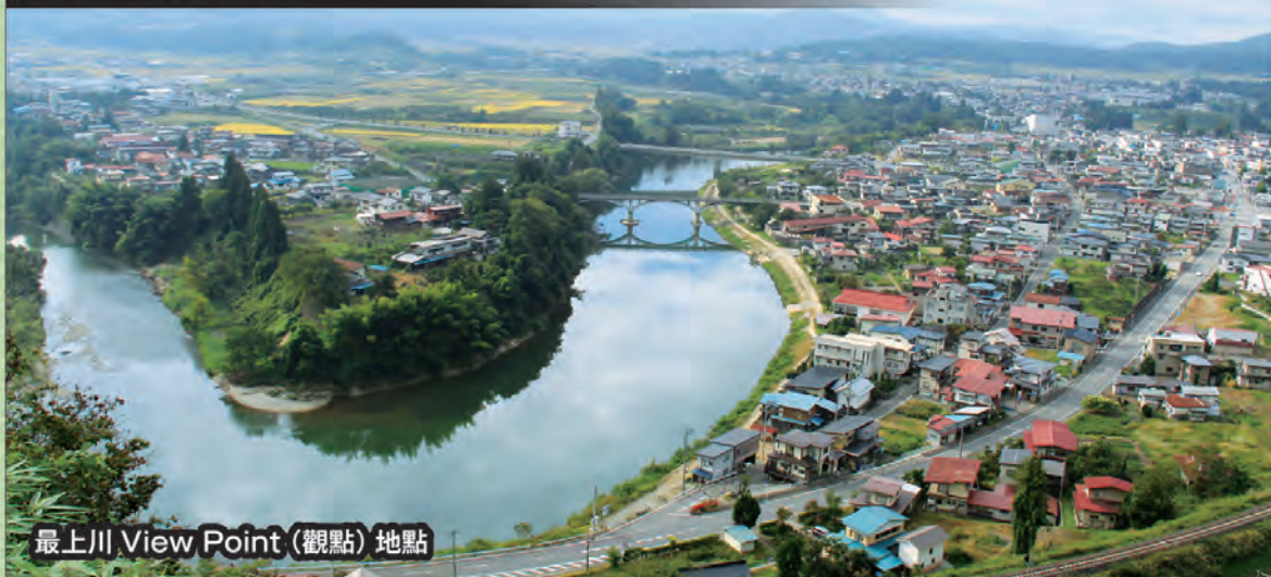
最上川 View Point (觀點) 地點

位於JR左沢 (ATERAZAWA) 線的終點、左沢站北側的高臺、當地豪族大江氏左沢楯山城遺址內的公園。從頂上的涼亭上一眼望去，眼下迂迴流淌最上川氣勢磅礴的水流、朝日連峰、藏王的山巒一覽無遺。該場所被認定為全長299公里最上川風景最美的地方。畫家、攝影家從縣內外慕名而來。平成14年，被選為日本“游步百選”。