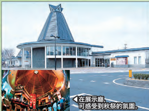
在展示廳 可感受到秋祭的氛圍。