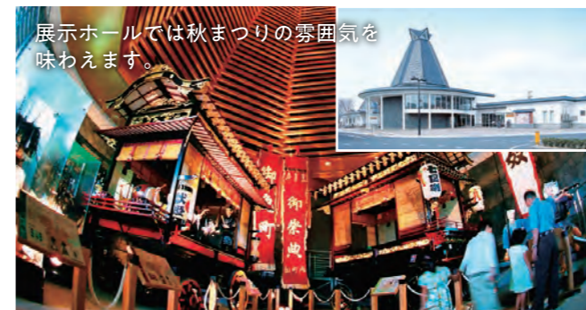
展示ホールでは秋まつりの雰囲気を感じられます。