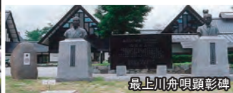
最上川舟唄顕彰碑