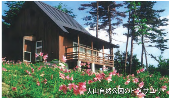
大山自然公園のヒメサユリ