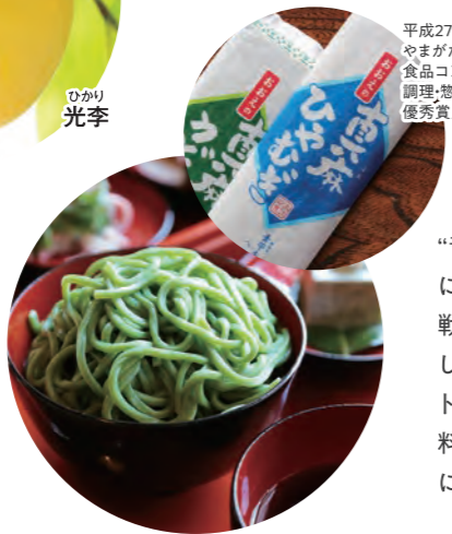
平成27年度 やまがたふるさと 食品コンクール 調理・惣菜加工部門 優秀賞受賞

「青苧」は、カラムシとも呼ばれ、古くから着物などの素材に使われてきた植物繊維です。大江町は、江戸時代から戦前まで全国的に高品質の青苧生産地として名を馳せました。現在は、本来の繊維としてだけでなく、葉をペースト状にしてさまざまな料理に使用しています。歴史民俗資料館では、10名からの完全予約制で郷土料理をベースにした「青苧御膳」を提供しております。