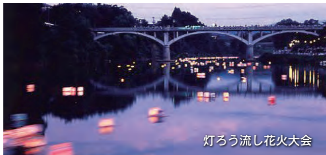
灯ろう流し花火大会