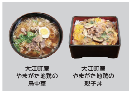
大江町産 やまがた地鶏の 鳥中華